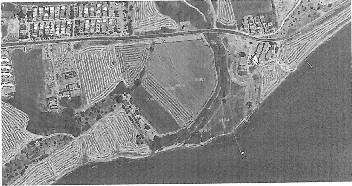
Resim.1 – Proje alanının uydu görüntüsü